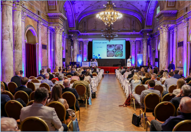
Obr. 3. Celý program JEUS 2026 se těšil vysoké návštěvnosti účastníků, vč. bloku Onemocnění prostaty.

Fig. 3. The entire JEUS 2026 program, including the session on Prostate diseases, attracted a large number of attendees.